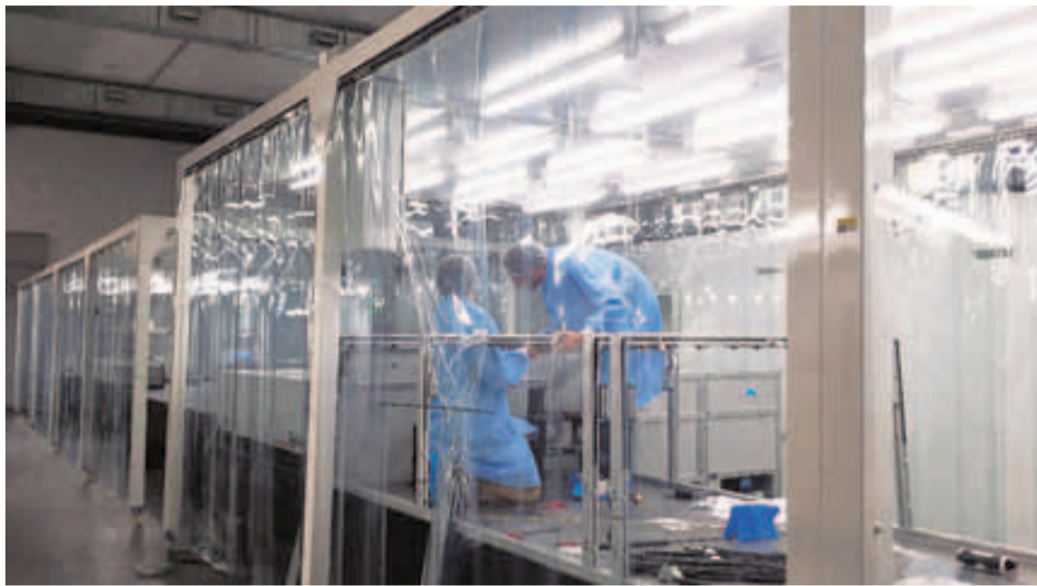
Imagen del montaje del láser de petavatio VEGA. :: WORD

Además de este público, y los estudiantes de secundaria, «que son ya habituales en las actividades de divulgación del Centro», esas mismas fuentes destacaron que el jefe de área científica impartirá el próximo jueves 12 una ponencia más especializada en la facultad de Física de la Universidad de Salaman-