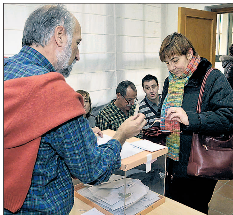
Los docentes elegirán a los integrantes de la junta de personal el día 4. / E. A.

en marcha la campaña electoral el día 18 de noviembre hasta el día 2 de diciembre. En la jornada de votaciones se instalarán 16 mesas electorales en centros de Segovia, Ayllón, Cantalejo, Carbonero el Mayor, Cuéllar, El Espinar, Santa María la Real de Nieva, Nava de la Asunción, Riaza y Navalmanzano.