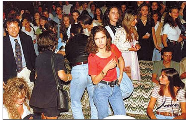
Armstrong, en pleno apogeo.

Armstrong fue un espacio singular en el centro de Burgos (calle Clunia). Allí recibió a algunos de los mejores artistas del momento, de todos los momentos: Tip y Coll, Los Pecos, Sergio y Es-