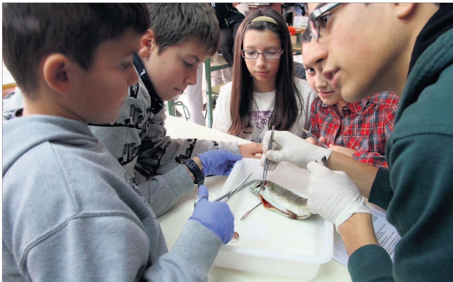
Alumnos del CEIP La Candelaria diseccionan una trucha en uno de los talleres del instituto Río Duero.

La I Semana de la Ciencia de Zamora acerca durante estos días las ramas del conocimiento a los alumnos más pequeños. Diferentes institutos de toda la provincia han organizado experimentos para enseñar a los estudiantes de primaria todas las posibilidades que ofrecen la biología, la tecnología, la física, la matemática o la astronomía, entre otras tantas. Las jornadas continuarán hasta mañana con sesiones de actividades y coloquios en los centros zamoranos.