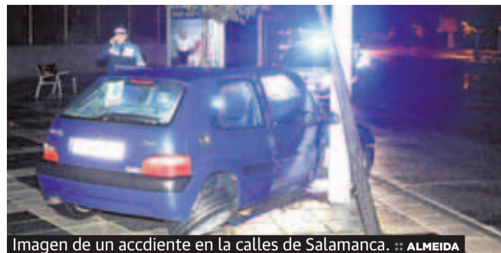
Imagen de un accidente en la calles de Salamanca.