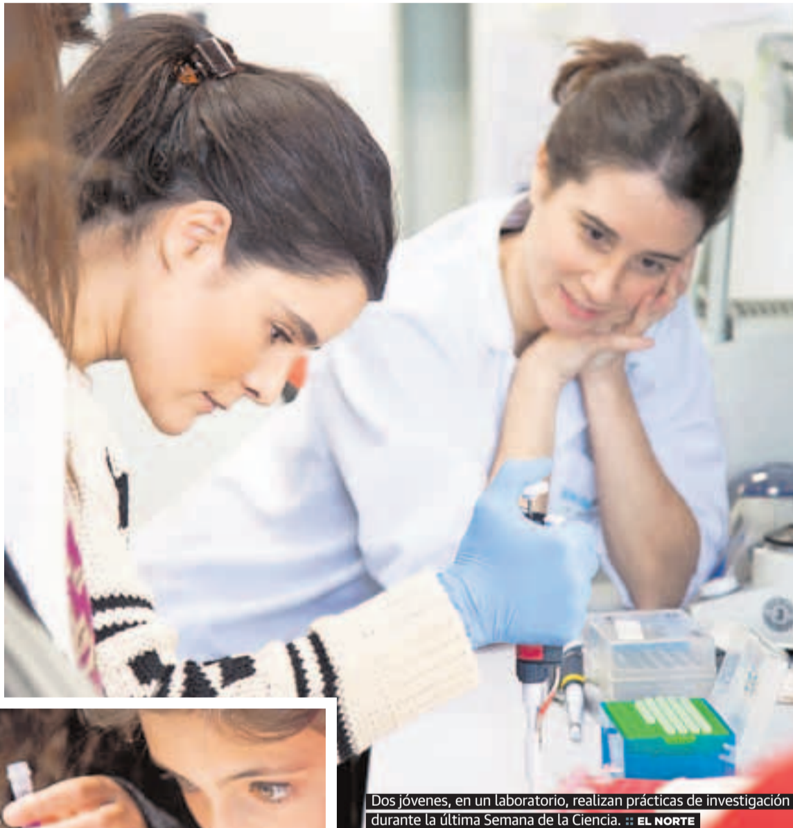
Dos jóvenes, en un laboratorio, realizan prácticas de investigación durante la última Semana de la Ciencia.

La Fundación ha contado con la colaboración de empresas y centros de investigación que abrirán sus puertas a estudiantes de Secundaria, FP y universitarios. Este año se visitarán 32 empresas y diferentes centros e institutos de investigación (CIC, CENIEH, IBGM, INCYL, IOBA). Además, para Educación Primaria se ha preparado el taller 'Pequeños científicos' del Museo de la Siderurgia y de la Minería de Sabero, en León; el 'Taller de celtiberos' de la Fundación Dinosaurios, de Burgos; y la yincana científica de la Fun-