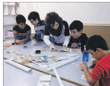
Niños participantes.

Los jóvenes iniciaron ayer la segunda fase del programa La Comunidad del Sereno, que comprende medio centenar de actividades en el Templete de la Marina y la Ciudad Deportiva. La iniciativa —que se repite viernes, sábado y domingo hasta el 6 de diciembre— está pensada en jóvenes de entre once y 16 años y se enmarca en el Plan Municipal de Drogodependencias.