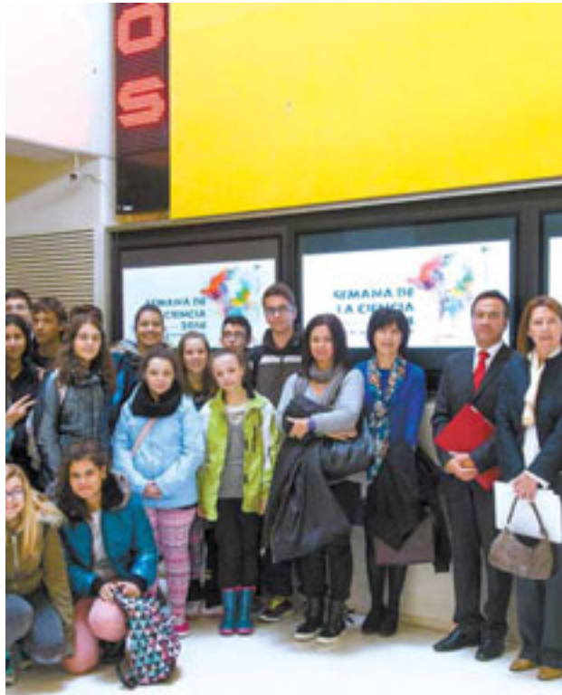
Inauguración oficial de la XII Semana de la Ciencia.

En este sentido, Fuescyl ha contado con la colaboración de empresas y centros de investigación de la Comunidad que durante la Semana de la Ciencia han abierto sus puertas a estudiantes de Secundaria, de FP y universitarios. Alrededor de 1.000 alumnos de todas las provincias han visitado 32 em-