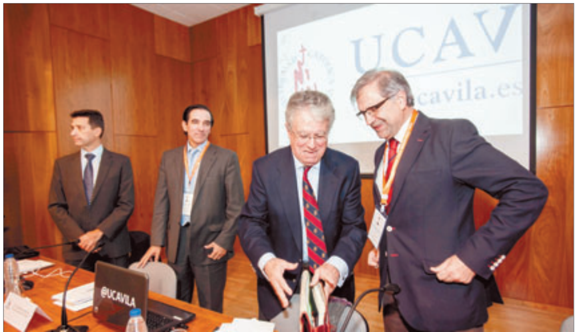
Participantes de la mesa redonda, poco antes de comenzar.

En este punto, abordó la posibilidad de complementar la pensión pública futura con un ahorro a largo plazo de manera individual o colectiva a través de la empresa para que el día de mañana tengamos dos pensiones. Todo ello teniendo en cuenta que en nuestro caso el desarrollo del sistema privado de pensiones es muy pequeño, lo que no sucede en otros países de Europa.