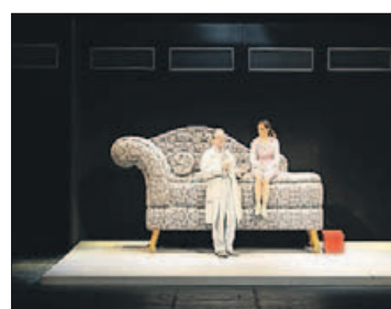
Escena de la obra.

El Teatro Principal acogió ayer la representación de «Lo que vio el mayordomo», una enloquecida comedia protagonizada por un prestigioso psiquiatra con su secretaria, con su mujer y la policía de por medio. Lola Marcellí, Pep Munné, Luis Fernando Alves, Mundo Prieto, Carolina Lapausa y Raúl Mérida conforman el reparto de la propuesta que visitó la capital.