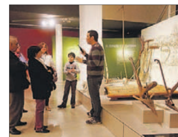
Visita guiada.