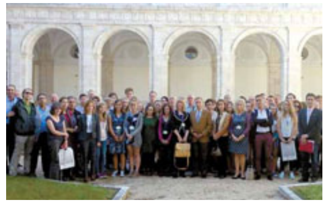
Participantes en el proyecto de cooperación.

La Consejería de Educación encuentra especialmente interesante la futura colaboración con la entidad sin ánimo de lucro Fundación La Caixa.