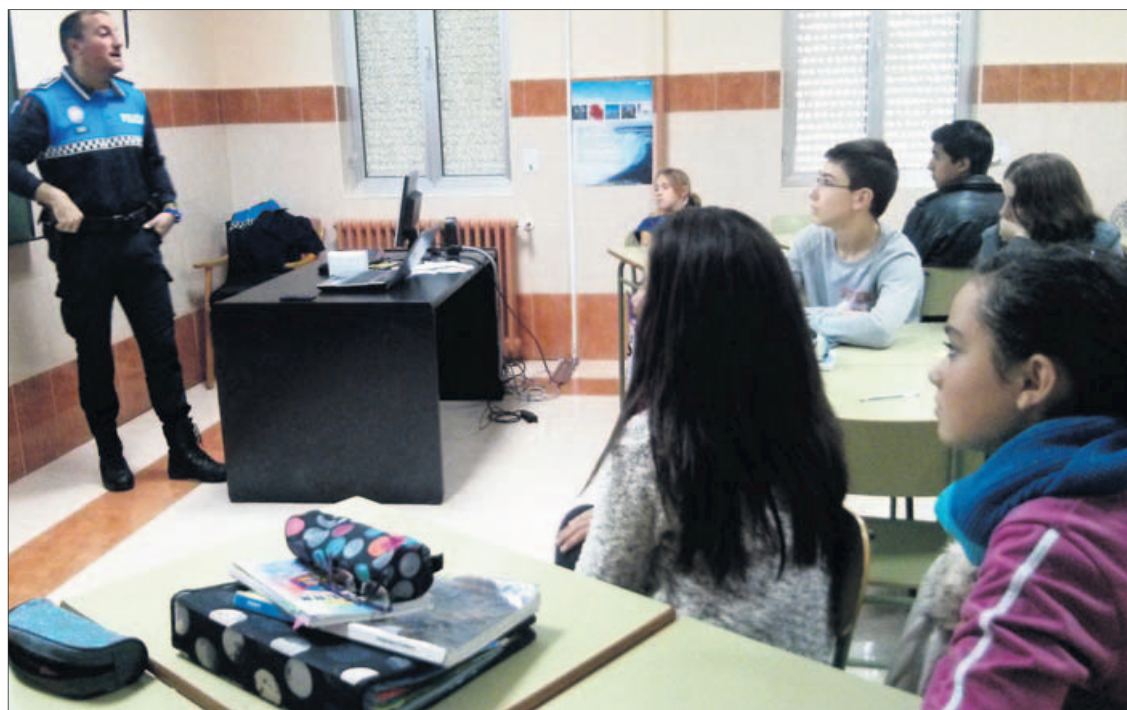
El alumnado atiende las explicaciones del policía municipal en el colegio San Vicente de Paúl.

«AyúdaME» es el título de la charla para edades entre 13 y 14 años. Con ella se pretende concienciar de los pasos a seguir en caso de sufrir o presenciar un accidente de tráfico. La llamada a los servicios de emergencia a través del 112, así como los primeros auxilios que se pueden realizar a las personas afectadas fueron algunos de los aspectos tratados a nivel informativo y recalando la importancia de su comprensión para luego poder aplicarlos en un caso real.