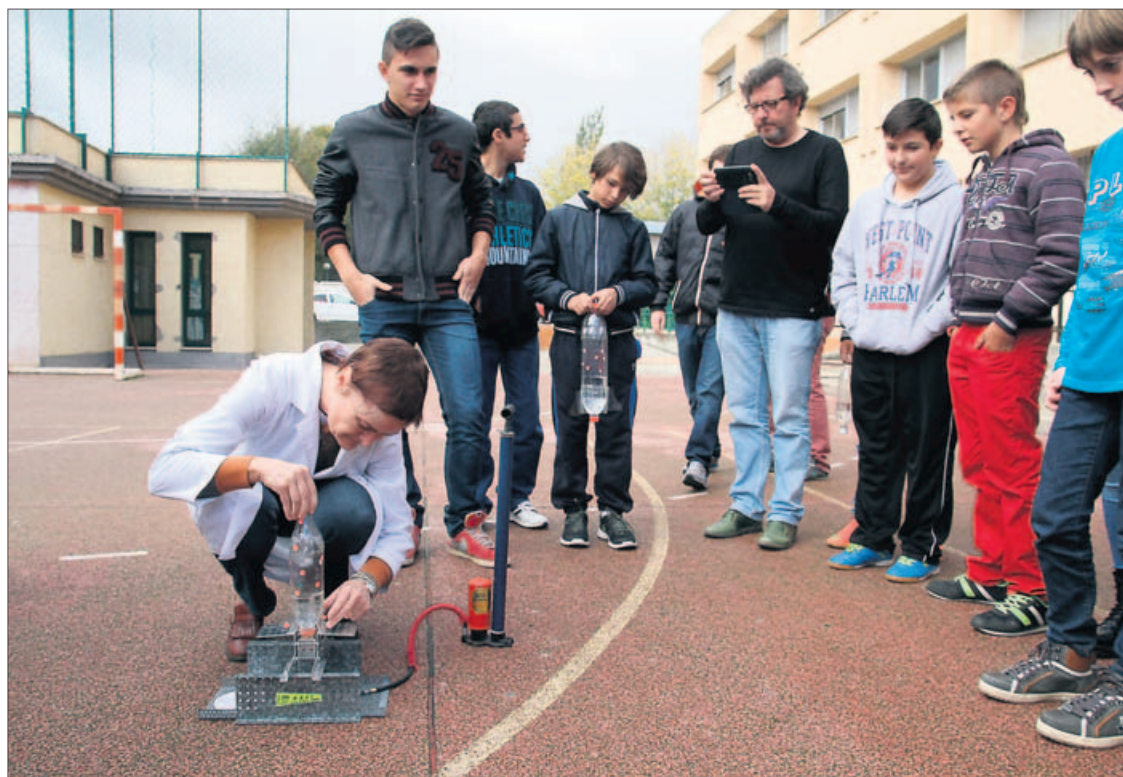
Participantes de la jornada preparan un experimento para hacer volar un cohete de agua.

El IES Río Duero se convirtió ayer en epicentro de la ciencia en la provincia por un día. Más de un centenar de alumnos de primaria de los colegios de Fuentesauco y La Candelaria acudieron al centro de Obispo Acuña para participar en una jornada en la que los experimentos fueron los grandes protagonistas. Fueron precisamente los alumnos de Fuentesauco quienes comenzaron la mañana tomando parte en uno de los experimentos más atrac-