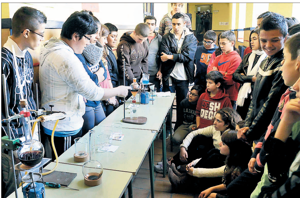
Imagen de alumnos del IES Mariano Quintanilla compartiendo conocimientos en talleres de experimentos.

La asociación Hespérides ha organizado una tertulia científica para el miércoles en el centro Joven El Altozano, de El Espinar, y para el viernes en el mismo escenario ha preparado una sesión titulada 'La evolución del conocimiento científico a través de los premios Nobel'.