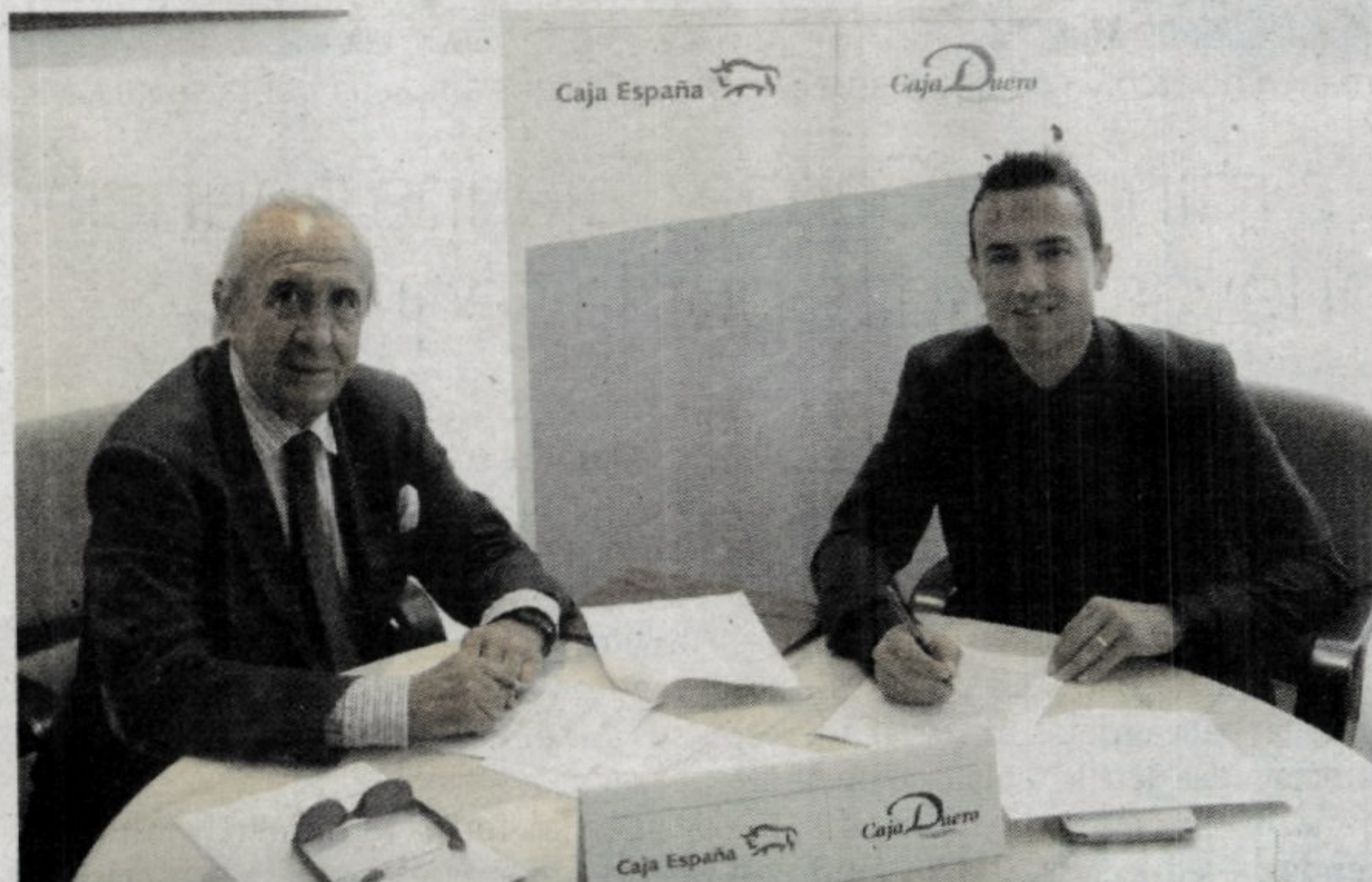
Un momento de la firma del acuErdo entre Caja España-Duero y Andade.

municado la entidad. En línea con este objetivo, la entidad pone a disposición de los miembros de Andade una selección de productos en condiciones preferentes, adecuados para las demandas de las personas que han pasado por un proceso de amputación. Destacan las facilidades en acceso a crédito para financiación de prótesis, automóviles adaptados o reformas en las viviendas para hacerlas más accesibles. También dispondrán de ventajas en préstamos hipotecarios, seguros, planes de pensiones, fondos y otros servicios financieros para sus proyectos empresariales.