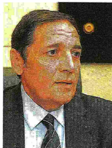
El consejero de Sanidad

Según precisó, en 2014 se podrá contar con las primeras unidades y áreas de gestión clínica «con el objetivo de dar mayor autonomía y capacidad de decisión a los profesionales para organicen su trabajo de forma que les permita obtener mejores resultados». El con-