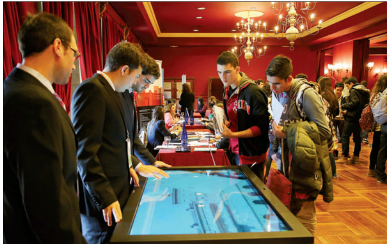
Un grupo de estudiantes, ayer en San Marcos asesorándose sobre la oferta universitaria. SECUNDINO

Titulaciones convencionales como Medicina y Enfermería, lo mismo que las ingenierías, rivalizaron en lo que toca al principal interés de los estudiantes con otras del ámbito medioambiental y también de las últimas tecnologías. «Así-