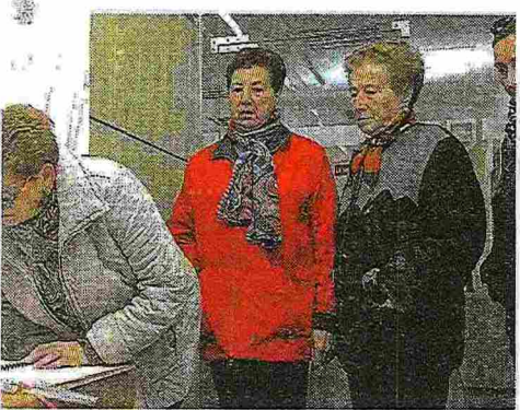
nto de la localidad.

SORIA. La Consejería de Sanidad de Castilla y León se ha fijado como objetivo prioritario para 2014 incidir en algunas de las medidas del Plan de mejora de listas de espera donde se establecerán protocolos de inclusión en listas de espera quirúrgica con seguimiento de las tasas de inclusión de las patologías más relevantes. Además, el departamento que dirige Antonio Sáez Aguado trabajará en la mejora de la cirugía ambulatoria con el objetivo de que el próximo año el 67,9% de los 25 procesos seleccionados se realicen mediante cirugía mayor ambulatoria (CMA), a lo que se suma el compromiso ya avanzado por el consejero de insistir en la clasificación de los pacientes por prioridades para dar mayor relevancia a los criterios clínicos e intervenir a los pacientes con prioridad 1 antes de 30 días y con un seguimiento a través de las nuevas comisiones quirúrgicas.