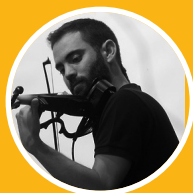
FRAN MM CABEZA DE VACA